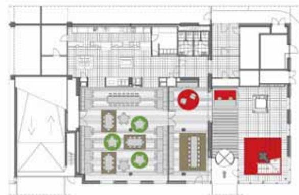
LINKS Plattegrond tweede verdieping met kleurschema vloerbedekking