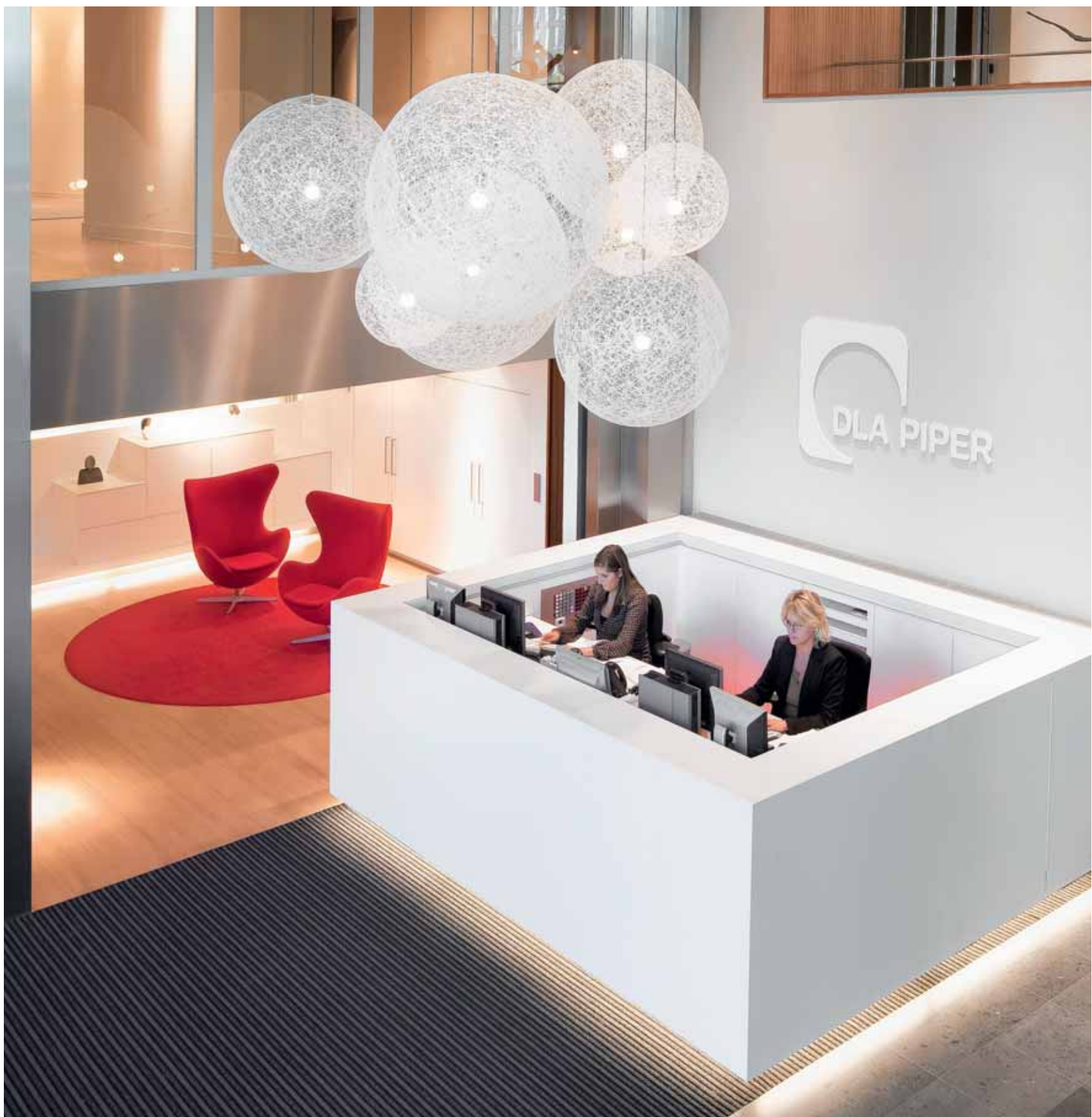
De entreeruimte